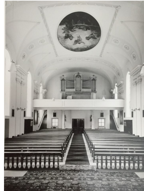
Empore und Orgelerweiterung nach der Renovation 1956

Der Grundriss der Kirche war streng symmetrisch, nördlich der Glockenturm, südlich die Sakristei. 1940 wurde unter Pfarrer Blum die Sakristei mit einer Türe versehen (direkter Zugang) sowie ein kleiner Anbau für eine Toilette errichtet. Bei der Renovation 1955/56 wurde die Sakristei nach außen stilgerecht erneuert und vergrößert.