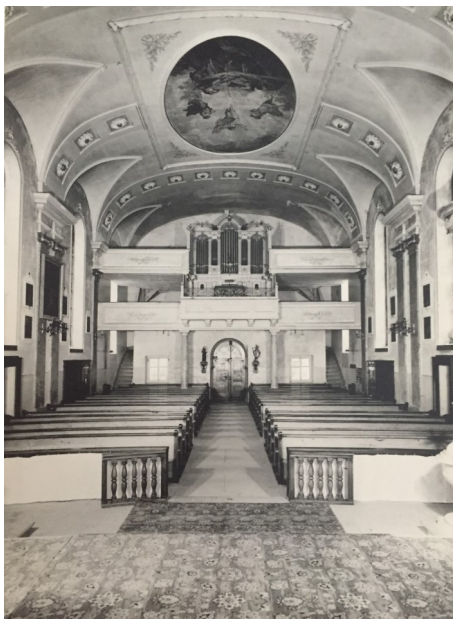
Orgel und Emporen nach dem Orgelumbau 1900