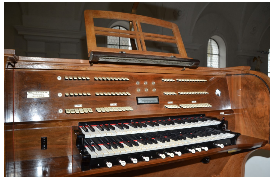
Elektrische Kegelladenorgel mit 22 Registern und 3 Transmissionen, 2-manualig