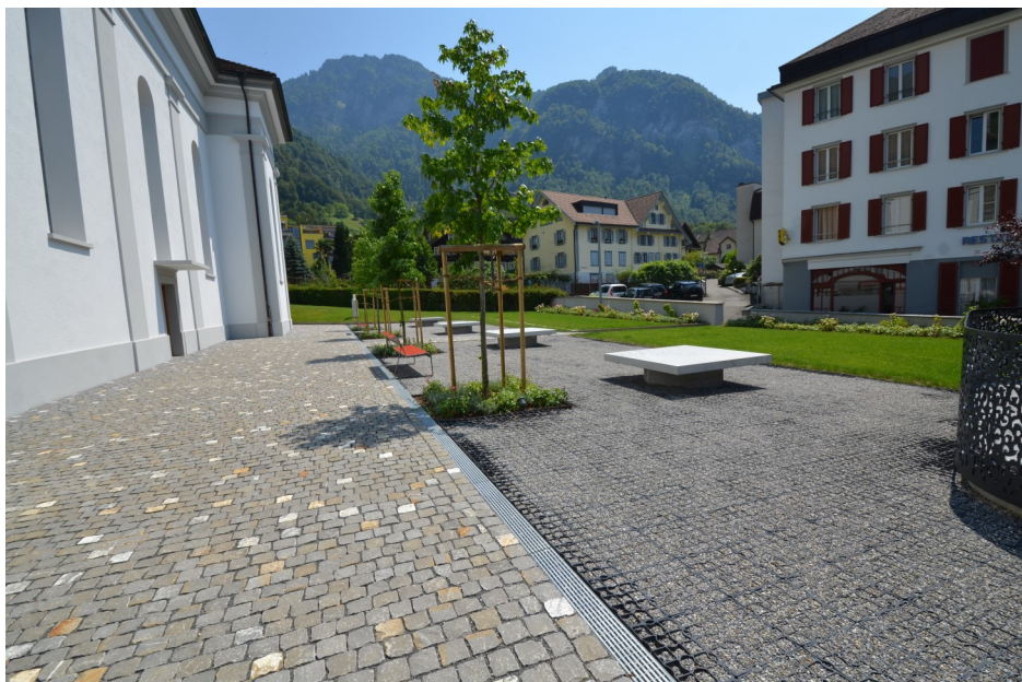
Kirchenplatz bei der Hieronymuskirche

Herausgabe und Druck: Sekretariat Luzerner Seepfarreien Greppen - Weggis - Vitznau Rigiblickstrasse 5 6353 Weggis