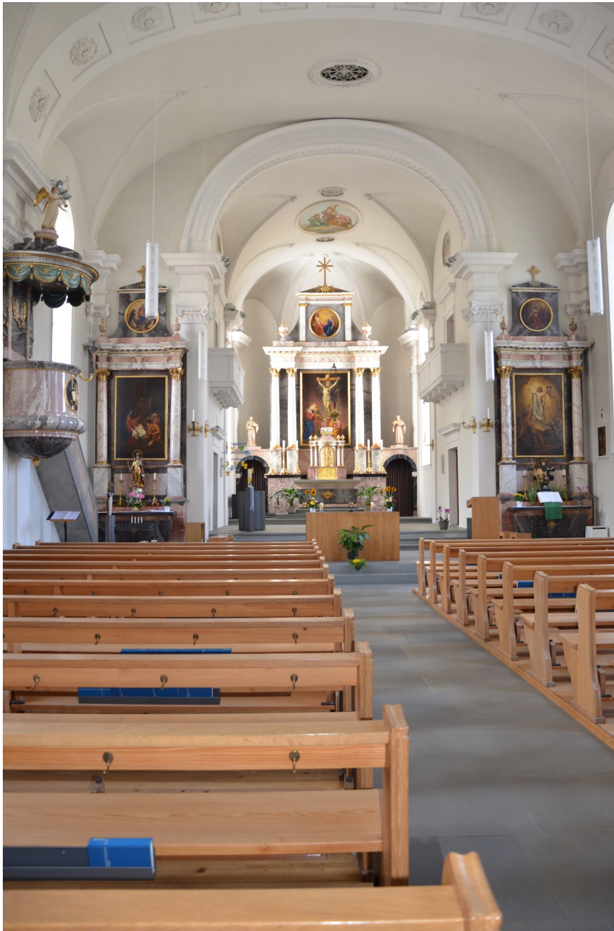
Innenansicht mit Chorraum nach der Renovation 2017