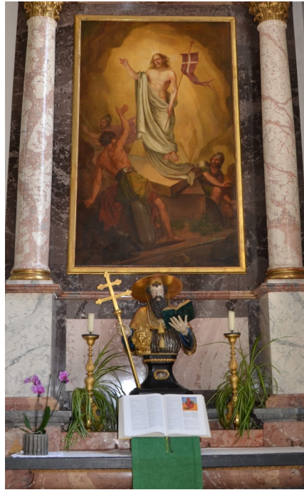
Seitenaltar rechts mit Büste des hl. Hieronymus

Das Holzkruzifix aus dem 17. Jahrhundert, das in einer steinernen Nische östlich des alten Friedhofes stand, wurde in den neuen Friedhof übernommen.