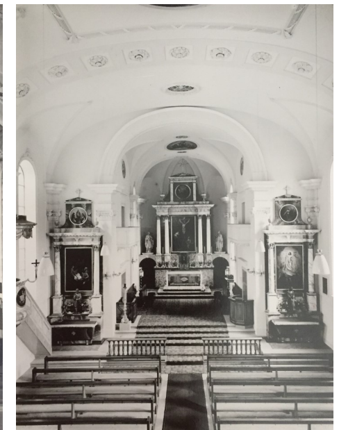
Kirche nach der Renovation 1956