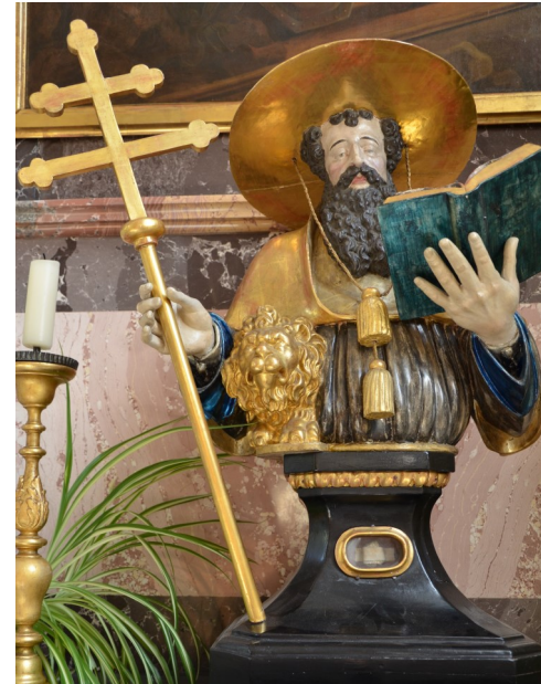
Statue des hl. Hieronymus Seitenaltar rechts

Nachdem durch Murgänge Teile der Siedlung im Altdorf verschüttet oder überschwemmt wurden, wobei 1674 auch die dortige Kapelle zerstört wurde, entwickelte sich das Dorf im Laufe des 13., 14., und 15. Jahrhunderts rund um die heutige katholische Kirche, mit Dorfkern oberhalb des heutigen Hotels Rigi, mit den Gebäuden Hofstetli, Obchillen, Grosserlen, Kleinerlen, Grasseli usw.