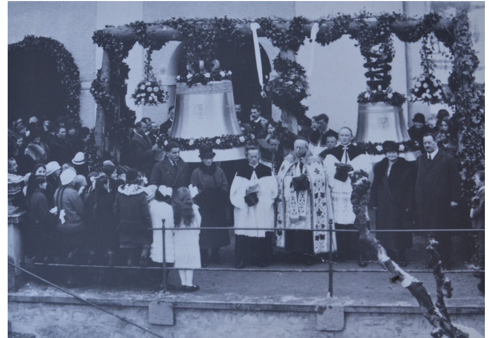
1927 - Einweihung der grossen und der dritten Glocke

Mit dem Bau der neuen Kirche in Vitznau wurde 1841 begonnen. Die Bauarbeiten wurden durch den Vitznauer Josef Weibel übernommen. Als Vorbild diente die Kirche in Adligenswil, die durch die Gebrüder Händli geplant wurde. Die Steine für den Bau der Kirche stammten teils aus der Buholzweid Vitznau, und teils von den Horwer Steinbrüchen. Das Holz für die Turmspitze und den alten Glockenstuhl stammte aus dem Eichwäldli unter der Weid, dasjenige für den Dachstuhl aus dem Binzifadwald (meistens Föhren). Der Transport der Baumstämme aus dem Binzifadwald erfolgte über einen Seilzug bis ans Ufer und von dort über den See bis zur Baustelle. Damals gab es noch keine Verbindungsstrasse zwischen Weggis und Vitznau. Die Kosten des Kirchenbaus betragen 48'820.00 alte Franken. In den Jahren 1838 - 1844 leisteten die Bürger der Gemeinde insgesamt 13'169 Tage Fronarbeit. Die Korporation Vitznau bezahlte rund 26'000 Franken an die Kosten des Kirchenbaus. Dabei verkaufte sie Holz aus den Wäldern Eichwäldli, Binzifad- und Heubergwald.