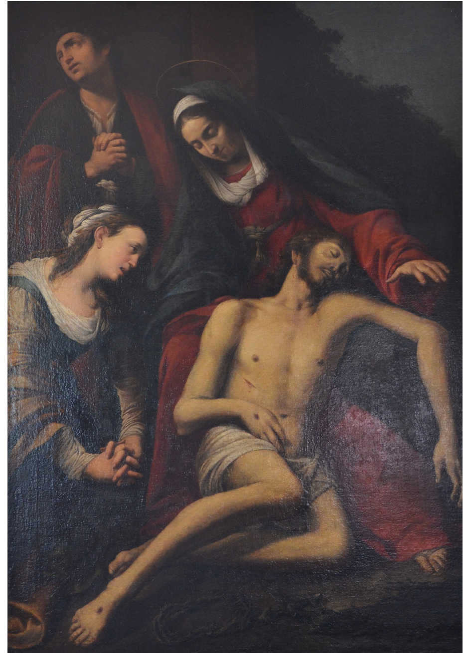
Pietà - Gemälde Beweinung Christi

Durch das rundbogige Hauptportal mit Kämpfern und einem Konsolenschlussstein betritt man den Kirchenraum, in dem der weite Chor von den Seitenaltären kulissenartig flankiert wird. Nach dem Chor hin öffnen sich beidseits Logen mit schmalen, rechteckigen Balkonen auf Konsolen. Im Westteil des Schiffs und über der Vorhalle wurde eine zweigeschossige Empore eingebaut, unten mit einem Balkonvorbau, im oberen Teil durch den Orgelprospekt unterbrochen. Bei der Innenrenovation 1955/56 wurde die obe-