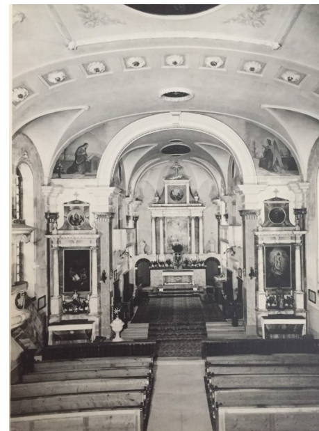
Kirche vor der Renovation 1956