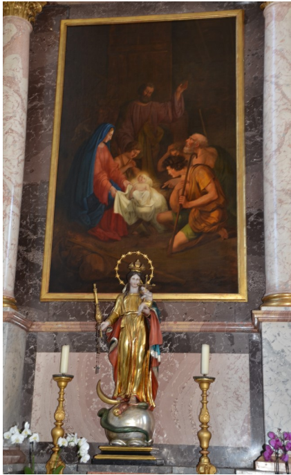
Seitenaltar links mit Statue der Muttergottes