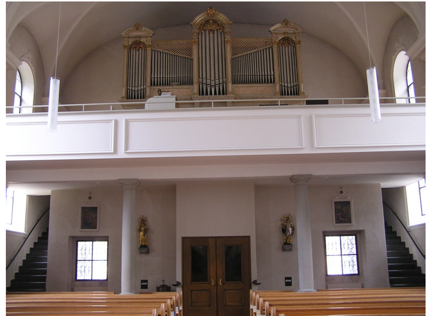
Innenansicht mit Orgel und Empore nach der Renovation 2017