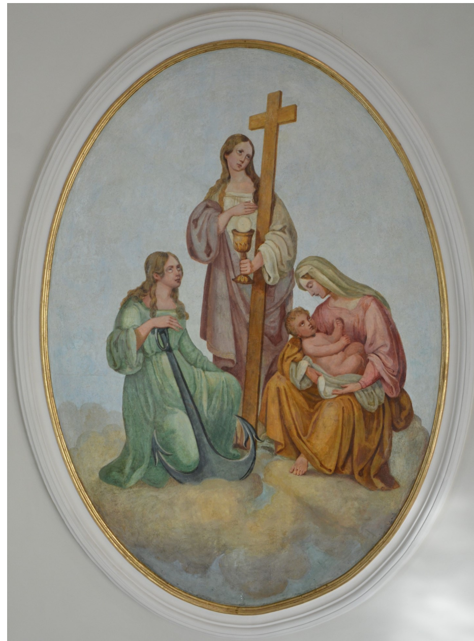
Deckenbild - Allegorie von Glaube, Hoffnung und Liebe