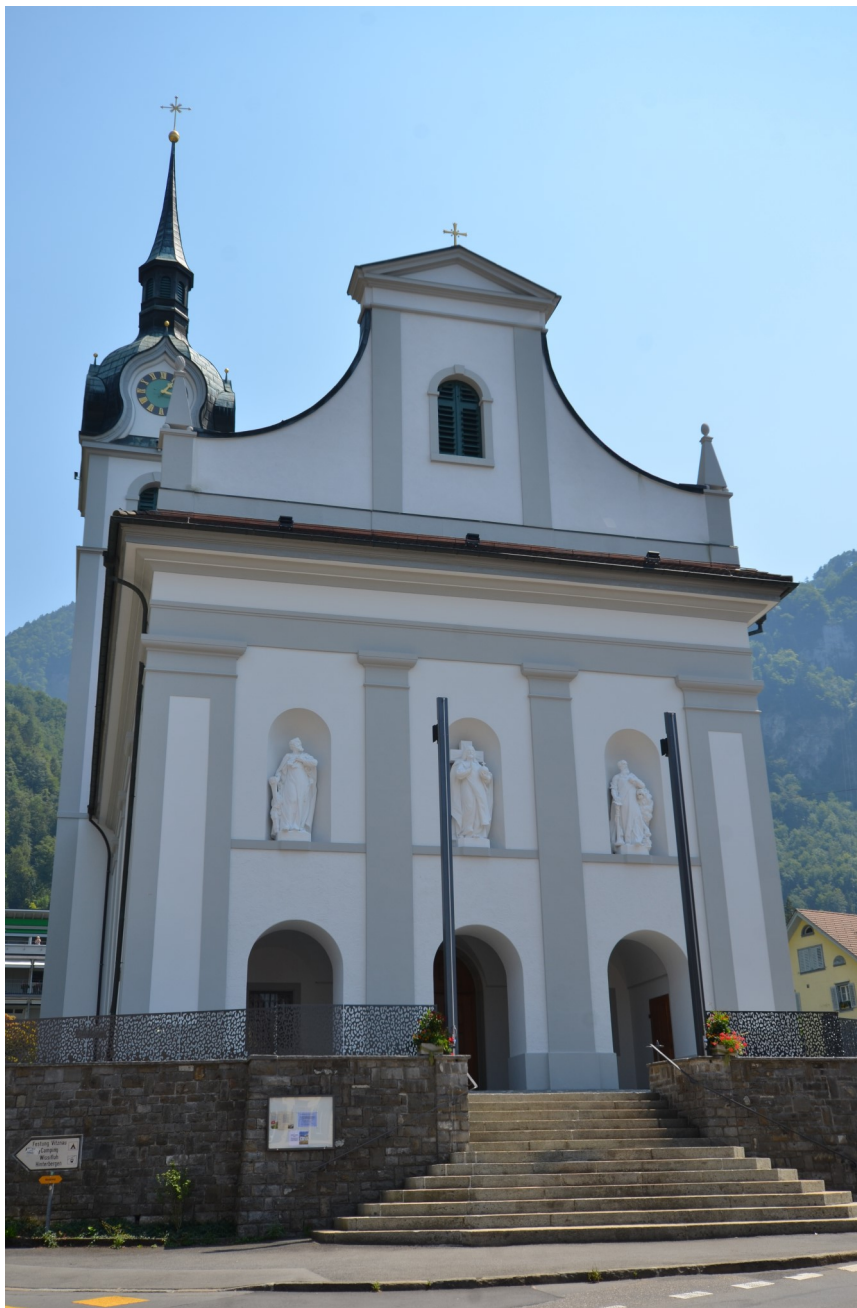
Westfassade der Pfarrkirche St. Hieronymus nach der Renovation 2017