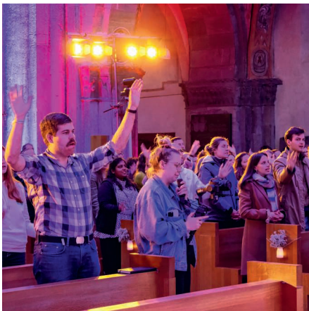
Impression des Weltjugendtags 2024 in Chur.