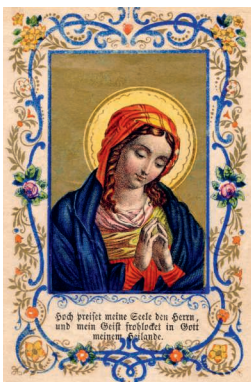
Heiligenbild aus den 1860er-Jahren.

«Aus der Not geboren», Landesmuseum Zürich, noch bis 20. April