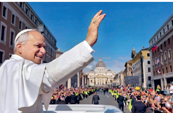
Papst Leo hat ein dichtes Reiseprogramm vor sich.

Als nächste Schritte folgen die Traktandierung in der Synode durch den Synodalrat sowie die Genehmigung durch die Synode. Der Vollzug ist anschliessend auf den 1. Januar 2027 vorgesehen.