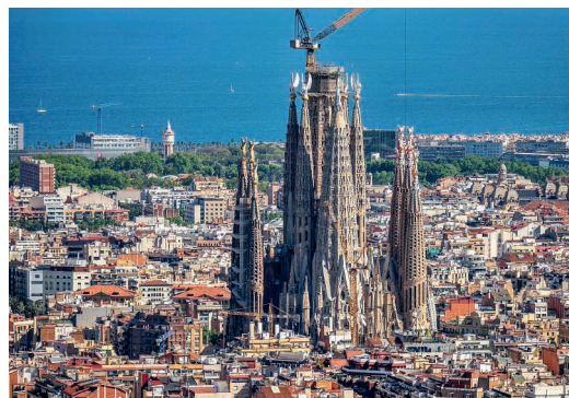
Seit 1882 im Bau: Sagrada Família in Barcelona.

Mit dem Aufsetzen des ersten Kreuzsegments hat der Kirchturm der Sagrada Família (162,9 m) in Barcelona jenen des Ulmer Münsters (161,53 m) überholt. Damit ist die endgültige Höhe von 172,5 Metern erreicht, obschon das Werk des katalanischen Künstlers Antonio Gaudí nach wie vor nicht fertig ist. Gaudí legte fest, dass die Kirche den höchsten Hügel von Barcelona (177 m) nicht überragen dürfe.