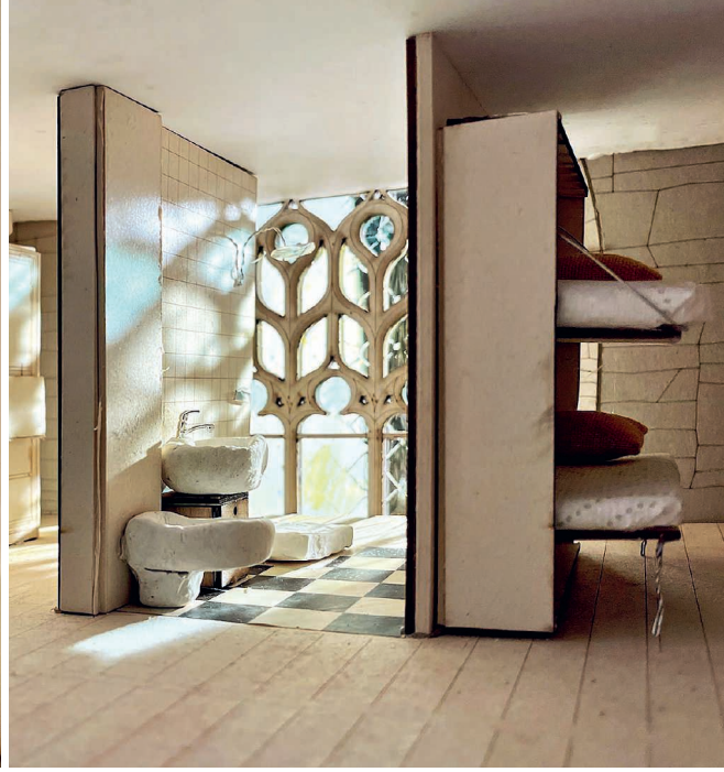
Die typischen Fenster der Kirche St. Paul sollen auch nach der Umwandlung in Wohnraum sichtbar bleiben.